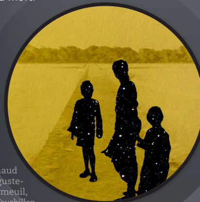
Renaud Auguste-Dormeuil, Le Tourbillon de la vie #02 , 2013