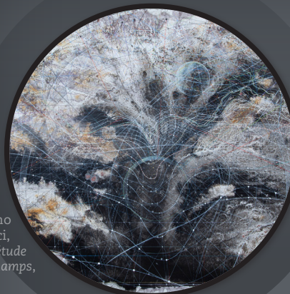
Pancho Quilici, Inquiétude des champs , 2017